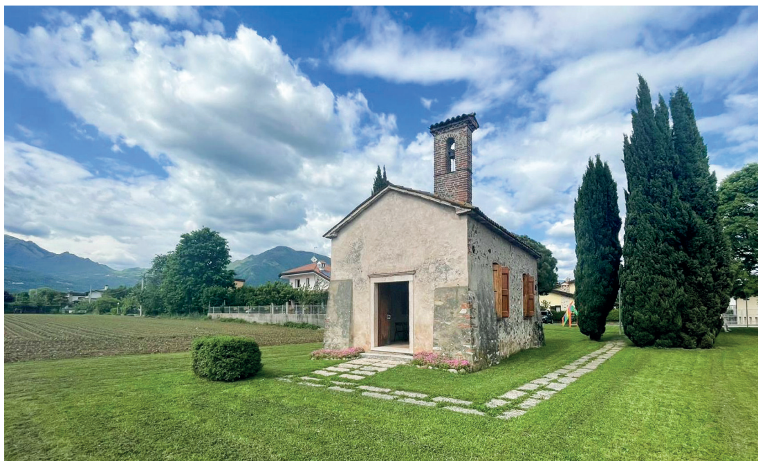
Fig. 1: La Chiesetta di Santa Giustina, a Giavenale di Schio