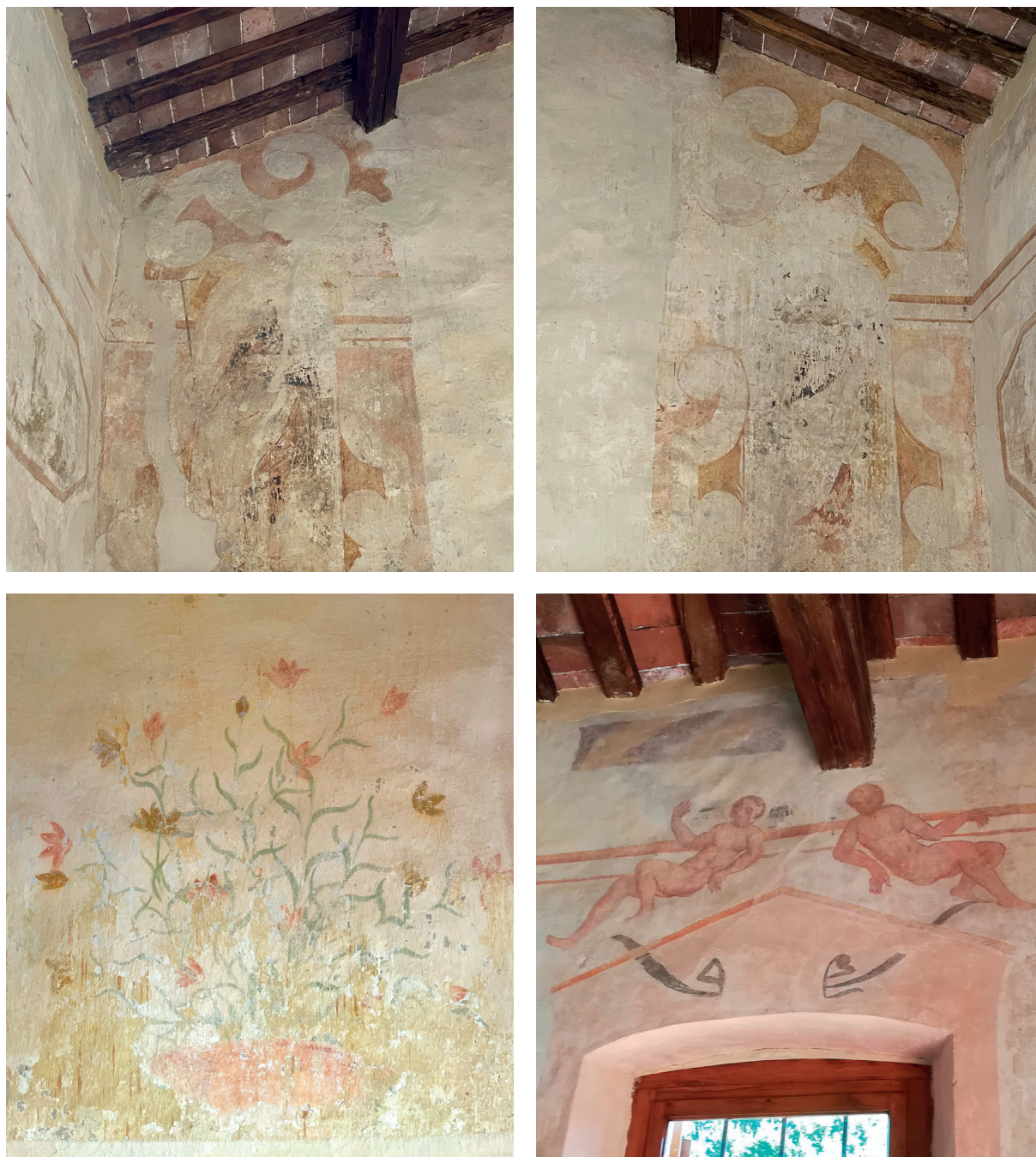
Fig. 8, 9, 10 e 11: dettagli degli affreschi

di affreschi, ma di tempere a secco su intonaco, tecnica che si deteriora molto più facilmente dell'affresco: questo spiega anche il pessimo stato di conservazione. Gli "affreschi" sono contemporanei alla costruzione della chiesetta, 1581, o di poco posteriori. L'apparato decorativo si compone dell'immagine di quattro santi, in alto, ai lati della navata. Rispetto a chi entra vi sono raffigurati: nella parete anteriore a sinistra S. Felice e a destra S. Sebastiano, le due tempere meglio conservate. Nella parete posteriore a sinistra S. Rocco e a destra S. Fortunato. S. Felice e S. Fortunato sono i santi protettori di Vicenza e i fratelli Ferro erano nobili Vicentini. S. Sebastiano e S. Rocco sono i santi protettori contro la peste. Infatti la chiesa fu costruita nel 1581, pochi anni dopo una terribile pestilenza che devastò il Vicentino nel 1575.