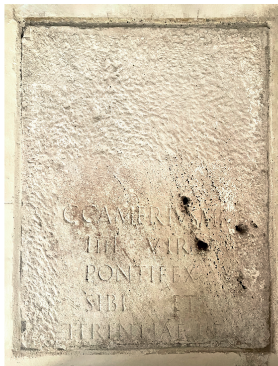
Fig. 3: L'epigrafe romana

Questa epigrafe è attribuibile all'età augustea, tra I sec. a.C. e I sec. d.C.. È incisa negli eleganti e forti caratteri della scrittura quadrata. Manca forse nella parte sommitale della lapide, quella erasa, la consueta dedizione D(IS) M(ANIBUS) agli dei mani, cioè alle anime dei defunti ed è mutila anche a destra e in basso. L'illustre personaggio, le cui proprietà terriere si estendevano presumibilmente anche nella zona di Giavenale, è ricordato come quadrumviro, essendo uno dei quattro magistrati preposti al governo del municipium vicentino. È inoltre indicato come uno dei pontefices, perché faceva parte di questo collegio religioso, cui spettava la sorveglianza del culto ufficiale e pubblico della città di Vicenza” 3 .