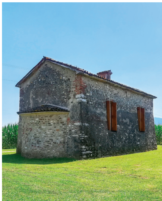
Fig. 4 e 5: L'esterno dell'edificio