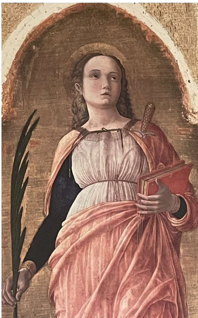
Fig. 12: il ritratto di S. Giustina

Attualmente la chiesa è visitabile grazie alla presenza di una guida degli Amici di Santa Giustina, un'associazione di 150 persone, che opera per una migliore conservazione e fruizione della chiesa e per una più approfondita conoscenza storica.