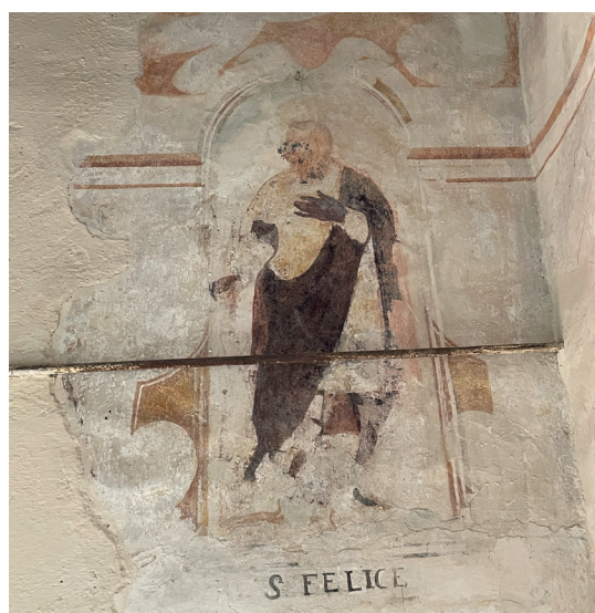
Fig. 7: affresco di S. Felice