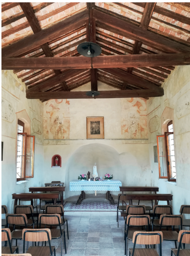
Fig. 6: l'interno dell'edificio