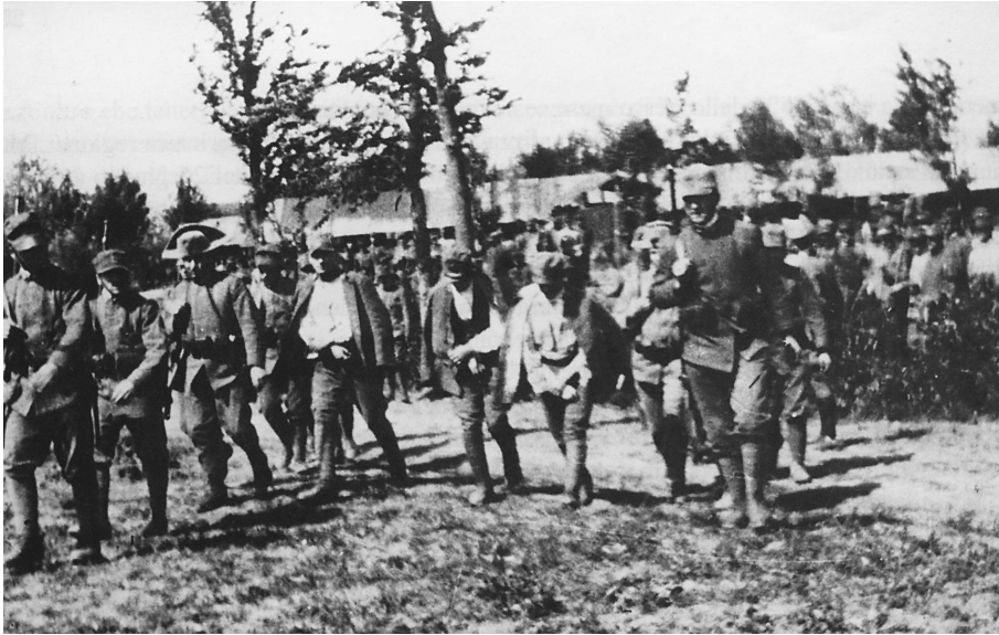
1917. Soldati portati alla fucilazione (coll. Mayer) (da PLUVIANO - GUERRINI, Le fucilazioni sommarie nella prima guerra mondiale , p. 24).

di Leguzzano: qui non vennero utilizzate disposizioni transitorie o circolari, ma articoli ben definiti dal codice di procedura militare in tempo di guerra. Il paesino bagnato dal torrente Giara, al momento dei fatti, era “zona di guerra” 26 , determinazione importante poiché a essa erano vincolate le sentenze dei vari tribunali militari. Nella zona di guerra, che si distingueva in zona delle operazioni e zona delle retrovie, ai comandanti militari era riconosciuta una potestà legislativa ex art. 251 Codice penale dell’esercito. Si trattava di una delega permanente del potere legislativo - circoscritta al tempo di guerra - che il Parlamento aveva attuato a favore dei comandanti militari e che si esercitava attraverso bandi, ordinanze e regolamenti 27 .