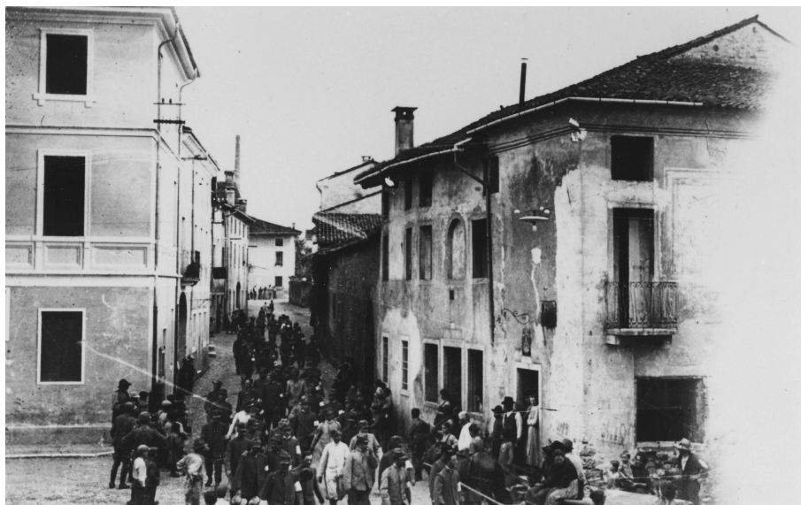
Soldati, in parte della Sanità, attraversano via Rigobello e la piazza di San Vito.

popolari al proseguimento della guerra. Le difficoltà alimentari e di approvvigionamento nutrono il malessere del fronte interno in Austria-Ungheria; la Germania combatte la crisi con una nuova economia che limita il principio della libertà d'impresa, il razionamento alimentare è la palliativa risposta all'embargo. Anche la Francia, già al quarto anno di guerra, conosce la realtà degli scioperi e delle agitazioni operaie; le rivolte in seno all'esercito vengono pesantemente sedate. In Russia le manifestazioni popolari di marzo preparano il terreno alla rivoluzione di ottobre, con conseguente fine dello zarismo. Tre milioni di morti e cinque milioni di feriti avranno il loro peso sull'ascesa di Lenin.