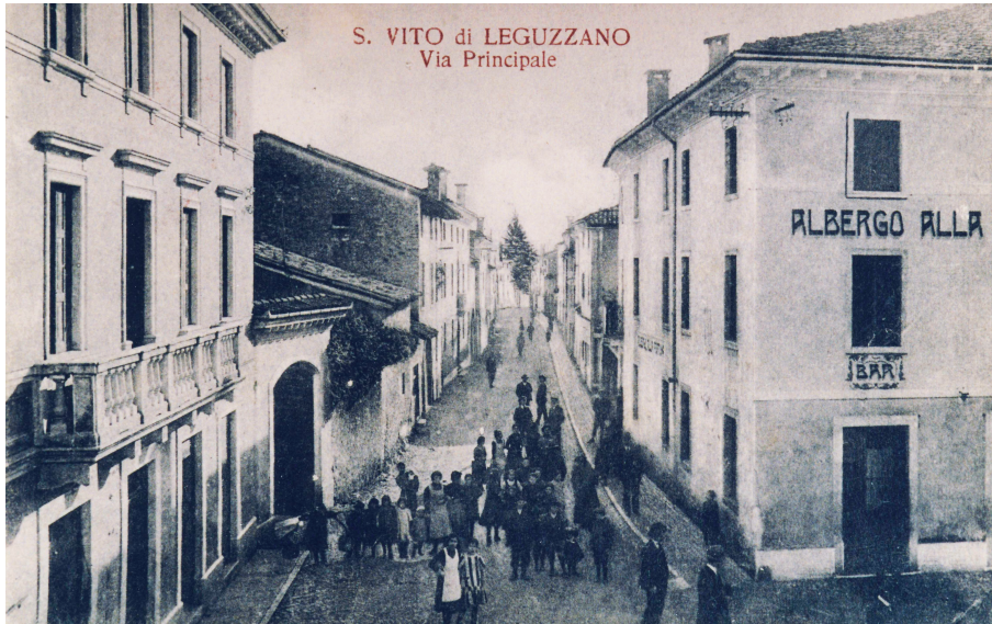
L'attuale via Roma in una cartolina spedita il 14 agosto 1917 da un soldato dell'8° Rgt. fanteria di marcia.